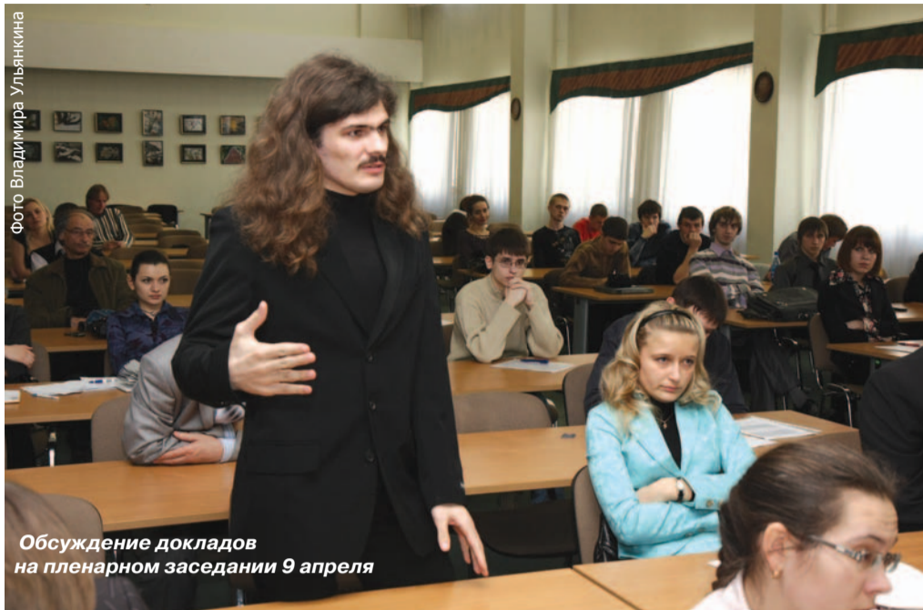
Обсуждение докладов на пленарном заседании 9 апреля

Ежегодное подведение итогов студенческой научной деятельности – давно сложившаяся в БелГУ традиция, которая объединяет преподавателей, студентов и сотрудников всех кафедр университета и превращает одну апрельскую неделю в праздник научного творчества.