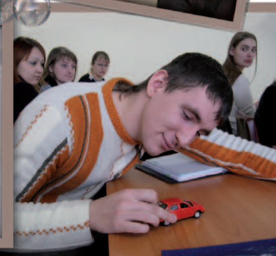
► Представляем автора