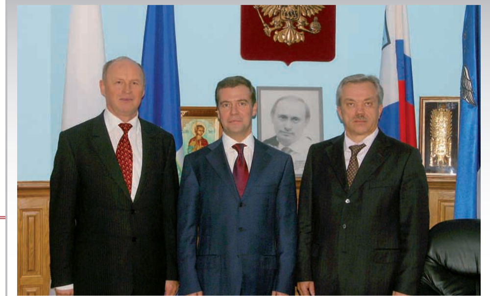
Д.А. Медведев - гость БелГУ

страны? Ваши потребности созвучны с современными тенденциями общества: владеть информационными технологиями на столь же высоком уровне, что и иностранным языком? Тогда ваш выбор – специальность 050202.65 «Информатика» с дополнительной специальностью «Иностранный язык»!