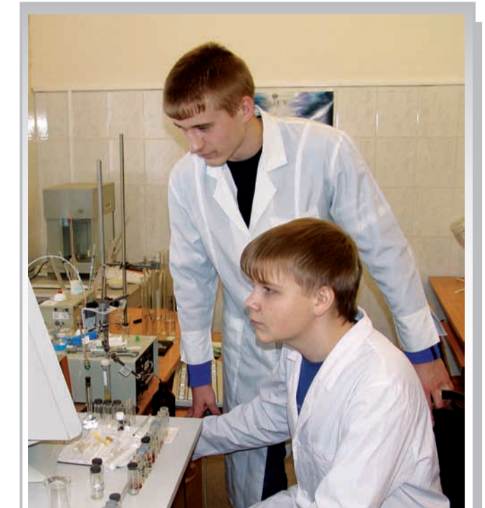
Учебный процесс в БелГУ обеспечен новейшим оборудованием

Факультет гордится своими спортивными достижениями. Среди выпускников – Заслуженные мастера спорта, чемпионы и призёры Олимпийских игр, чемпионы мира, Европы и России. Достаточно назвать такие имена, как: Светлана Хоркина – двукратная Олимпийская чемпионка по спортивной гимнастике, неоднократная чемпионка мира, Европы, России, Заслуженный мастер спорта, кандидат педагогических наук, депутат Государственной Думы РФ; Юрий Куценко – серебряный призёр Московской Олимпиады 1980 года по легкоатлетическому десятиборью, Заслужен-