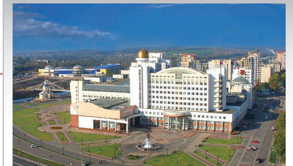
Главный корпус БелГУ - яркая достопримечательность Белгорода

Факультет развивает контакты с другими странами. Кафедра английского языка поддерживает отношения с рядом высших учебных заведений США, налаживает деловые контакты с Великобританией.