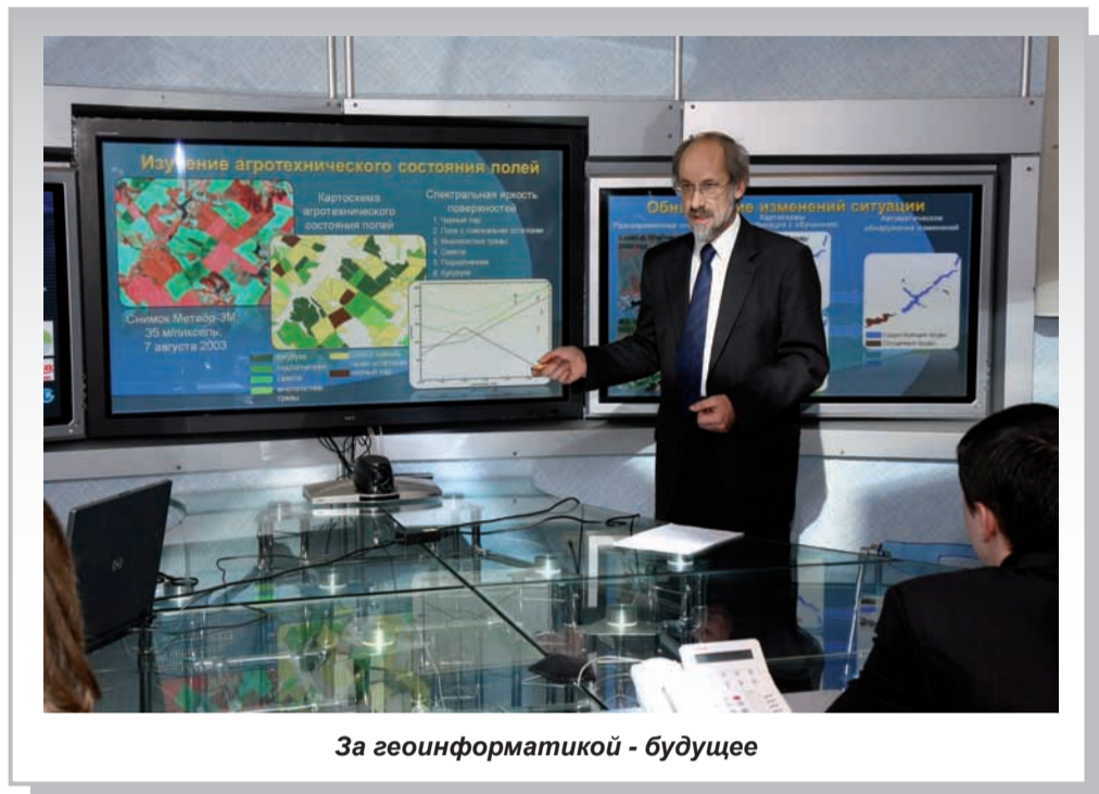
За геоинформатикой - будущее

Более 60 % выпускников работают в школах и органах народного образования. Многие выпускники работают директорами и завучами школ, в научно-исследовательских и природоохранных организациях, повышают свою квалификацию через магистратуру и аспирантуру.