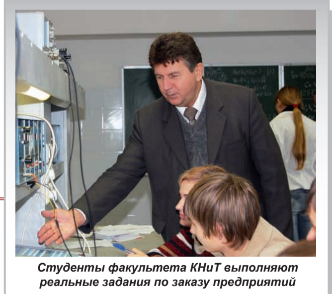
Студенты факультета КНиТ выполняют реальные задания по заказу предприятий

На факультете 3 кафедры: кафедра общей и клинической психологии, кафедра возрастной и социальной психологии и кафедра педагогики, на которых работают 55 преподавателей, в том числе 15 докторов и 23 кандидата наук.