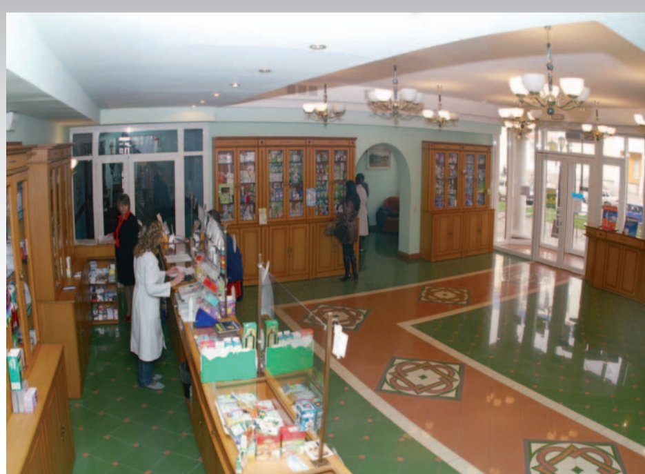
Аптека БелГУ - прекрасная учебно-производственная база для студентов-фармацевтов

В настоящее время обучение ведется на дневном и заочном отделениях на бюджетной и договорной основах. Осуществляется прием иностранных студентов.