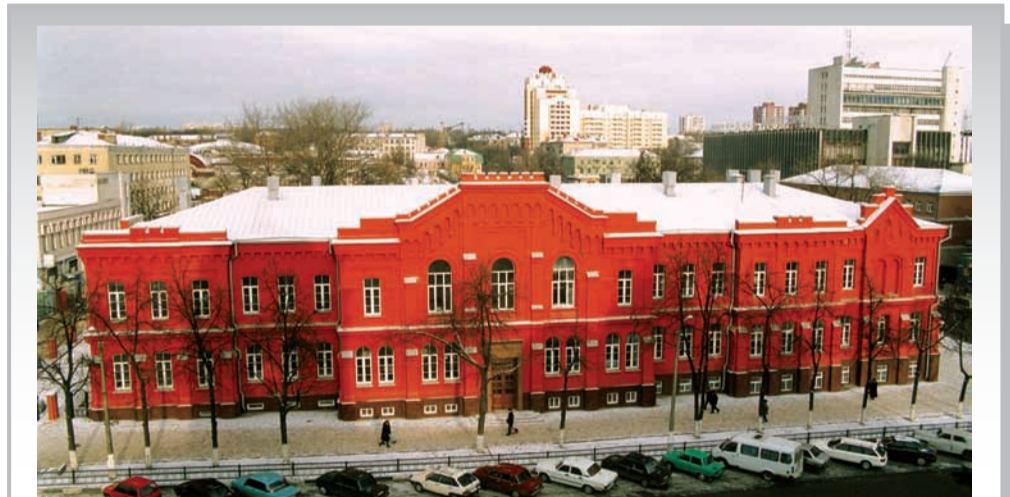
Здание социально-теологического факультета БелГУ - памятник архитектуры XIX века, охраняемый государством

Кафедра философии ведет подготовку специалистов