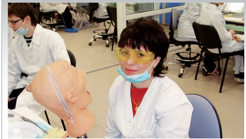
Будущие стоматологи занимаются в современном фантомном классе

Проблемные научные лаборатории: научно-исследовательская лаборатория молекулярной генетики человека; иммуногистохимических исследований позволяют осуществлять диагностику на молекулярном уровне. Сотрудниками факультета разработана и 26.03.2007 г. утверждена Учёным Советом БелГУ целевая программа «Здоровьесбережение» на 2007–2010 гг., которая является одним из приоритетных направлений социально-экономической политики университета. Стратегической целью этого направления является подготовка здоровых, конкурентоспособных специалистов, востребованных на рынке образовательных услуг. Общее количество студентов составляет 1076 человек, среди них 95 – иностранные граждане из 18 стран мира. За период с 2002 г. осуществлено 7 выпусков – это около 700 специалистов с квалификацией врач, из них 11 человек из стран Ма-