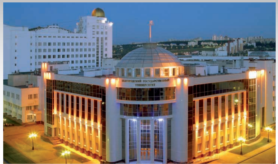
Здесь учатся будущие журналисты, фармацевты, студенты международного факультета

Более подробную информацию о развитии факультета, о студенческой жизни и творческих достижениях журфака можно получить на факультетском сайте http://journal.bsu.edu.ru/