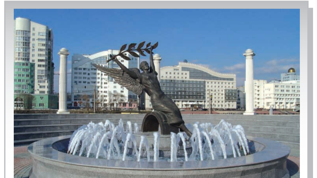
Богиня Ника - символ победы - «приземлилась» на площади Олимпийцев перед УСК БелГУ Светланы Хоркиной

050715.65 «Логопедия» с дополнительной специальностью «Специальная дошкольная педагогика и психология». Выпускники могут работать в общеобразовательных и специальных (коррекционных) образовательных и медицинских учреждениях, центрах реабилитации и коррекции, психолого-медико-педагогических комиссиях, могут вести частную практику в области специальной педа-