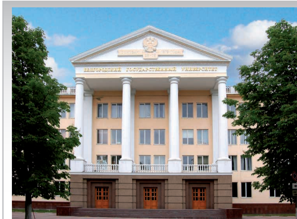
Первый корпус БелГУ по ул. Студенческой украшен классической колоннадой

Кроме того, многие выпускники с успехом работают