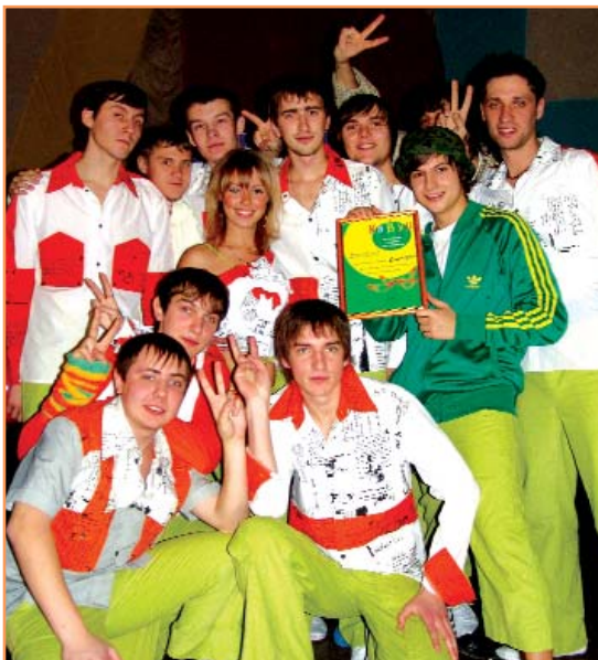
Сборная БелГУ «Пятый элемент» - участница I-ой Центральной лиги КВН, одна из лучших команд области

Обучение на педагогическом факультете - это не только учеба. Одаренных студентов и всех желающих ждет широкое поле деятельности: КВН, театр-студия, студенческие агитбригады, спортивные и творческие секции. Для увлеченных наукой - работа в студенческом научном обществе и проблемных группах, готовящих студентов к работе по гуманитарным, естественнонаучным и педагогическим направлениям исследований.