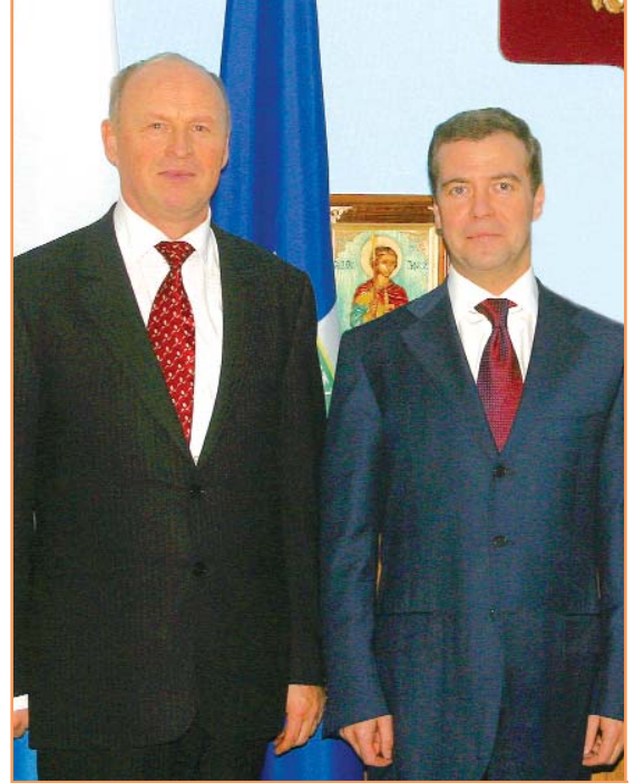
Первый заместитель Председателя Правительства РФ Д.А. Медведев - почетный гость БелГУ

Для абитуриентов биолого-химического факультета открыта бесплатная заочная школа "Юный химик". Ежегодно 4-5 выпускников этой школы становятся студентами факультета.