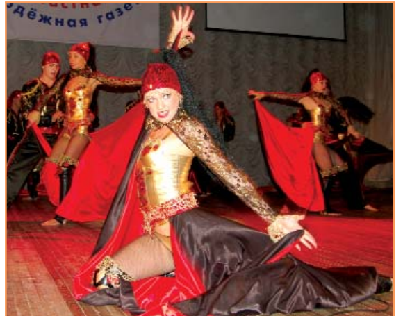
Университетский театр моды и танца "Стиль" в 2006 году стал победителем на чемпионате мира в Германии

При этом будущие программисты и системные администраторы - люди творческие, которые не остаются в стороне и от культурной жизни университета. Многие из них выступают в составе творческих коллективов БелГУ (арт-студии "Вереск"; студии современного танца "Данс Хаос"; ансамбля бально-спортивного танца "Белогорочка"; Ректорского духового оркестра).