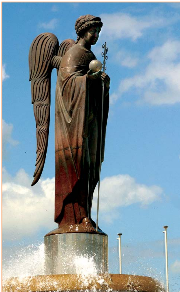
Архангел Гавриил, небесный покровитель университета, встречает студентов и преподавателей у главного входа в БелГУ

С 2003 г. на факультете РФ функционирует Научно-учебный центр иностранных языков (НУЦИЯ). Студенты любого факультета БелГУ могут получить дополнительную квалификацию - переводчик в сфере профессиональной коммуникации, обучаясь в НУЦИЯ. Обучение двухгодичное, осуществляется на договорной основе, зачисление производится по результатам собеседования. По окончании обучения выдается диплом государственного образца.