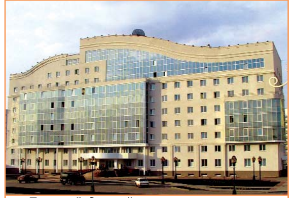
«Пятизвездочный отель» - так не шутя называют белгородцы новое общежитие нашего университета

Спортивно-оздоровительная работа на факультете проводится в рамках общеуниверситетских и факультетских мероприятий. На факультете создана команда по легкой атлетике, футболу, волейболу, баскетболу и шахматам.