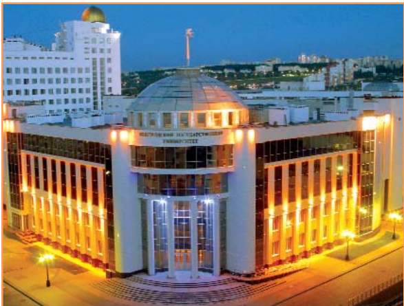
В этом корпусе учатся будущие журналисты, фармацевты, студенты международного факультета