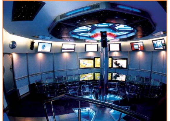
Это не cabina космического корабля. Так выглядит астрофизическая обсерватория БелГУ