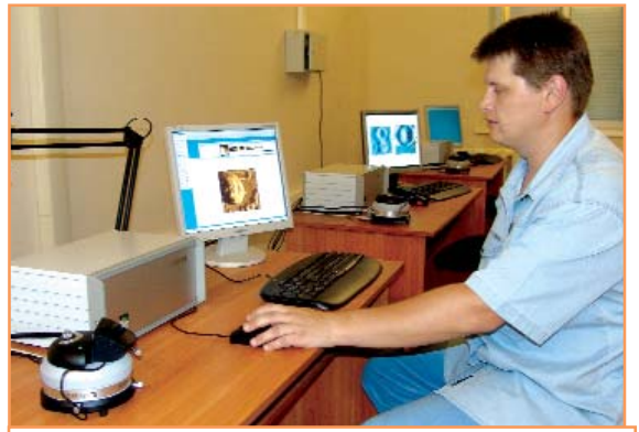
Центр наноструктурных материалов и нанотехнологий БелГУ активно реализует научные задачи третьего тысячелетия