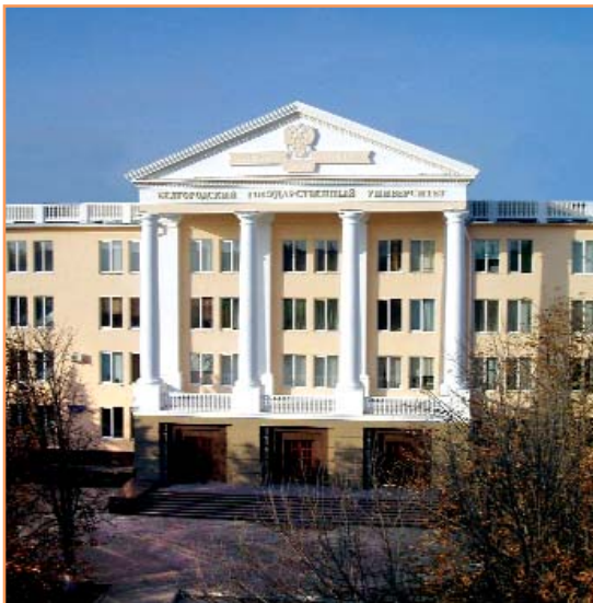
Классическая колоннада украсила вход в первый корпус БелГУ по улице Студенческой

Кроме того, многие выпускники с успехом работают в научно-исследовательской сфере - в архивах, музеях, библиотеках города и области в качестве сотрудников и руководителей подразделений; в средствах массовой информации в качестве редакторов, журналистов; занимаются экспертно-аналитической деятельностью - работают экспертами общественных и государственных организаций; организационно-управленческой - в органах федерального и регионального государственного управления, местного самоуправления Белгородской области, в системе органов внутренних дел, ГАИ, ФСБ, других силовых структурах.