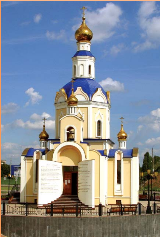
Православный храм Белгородского государственного университета, освященный во имя Архангела Гавриила