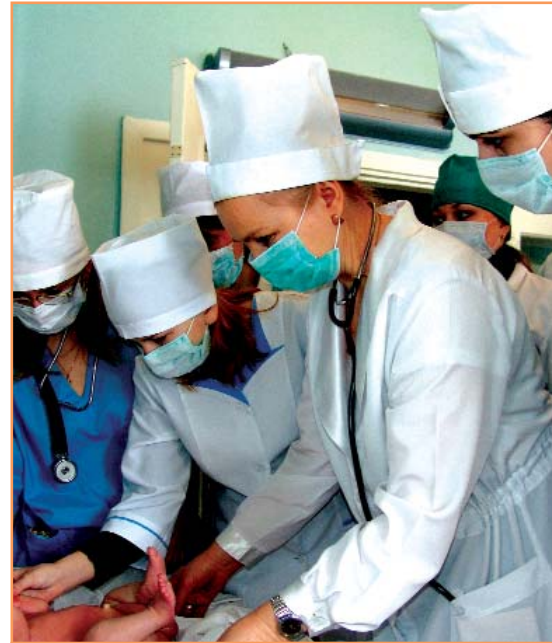
Студенты-медики практикуются в больницах под руководством высококвалифицированных врачей

Выпускники специальности "Сестринское дело" имеют возможность продолжить образование в интернатуре, клинической ординатуре по программам послевузовской профессиональной подготовки в соответствии с перечнем, утвержденным Минздравом РФ для специальности 060109 "Сестринское дело" .