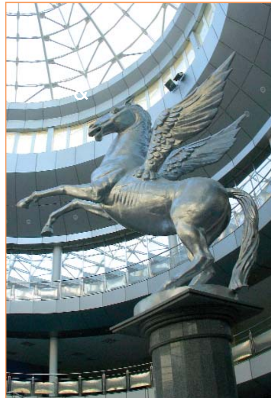
Пегас, символ Белгородского государственного университета, занял почётное место под сводами спортивного центра