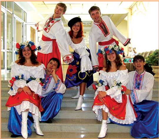
Арт-студия "Вереск" - победитель многих престижных международных и российских конкурсов вокалистов