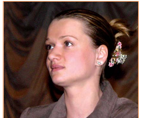
Наша гордость - Светлана Хоркина, выпускница БелГУ