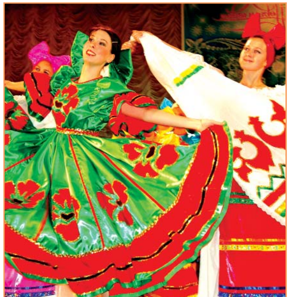
Коллективу классического танца "Алиса-Терпсихора" исполнилось двадцать лет

Желающим повысить свой профессиональный уровень институт предлагает разнообразные программы дополнительного профессионального и последипломного образования. Для тех, кто стремится к достижениям в науке, есть возможность продолжить образование в аспирантуре и докторантуре.