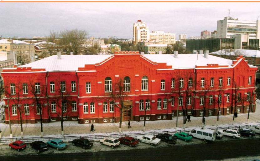
Здание социально-теологического факультета БелГУ - памятник архитектуры XIX века, охраняемый государством

Имеется собственная библиотека, насчитывающая около 9000 экз. учебно-методической литературы. Студентам предоставлен доступ в электронный каталог библиотеки. Все изучаемые дисциплины достаточно обеспечены учебно-методической литературой. Фонд библиотеки все время пополняется.