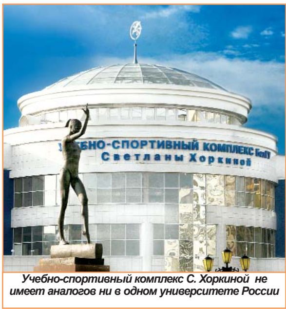
Учебно-спортивный комплекс С. Хоркиной не имеет аналогов ни в одном университете России