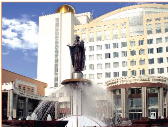
Главный корпус БелГУ - яркая достопримечательность нашего города