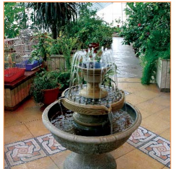
Зимний сад - место для работы и отдыха преподавателей и студентов БелГУ