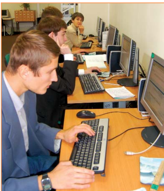
В библиотечном фонде более одного миллиона источников литературы в печатном и электронном виде