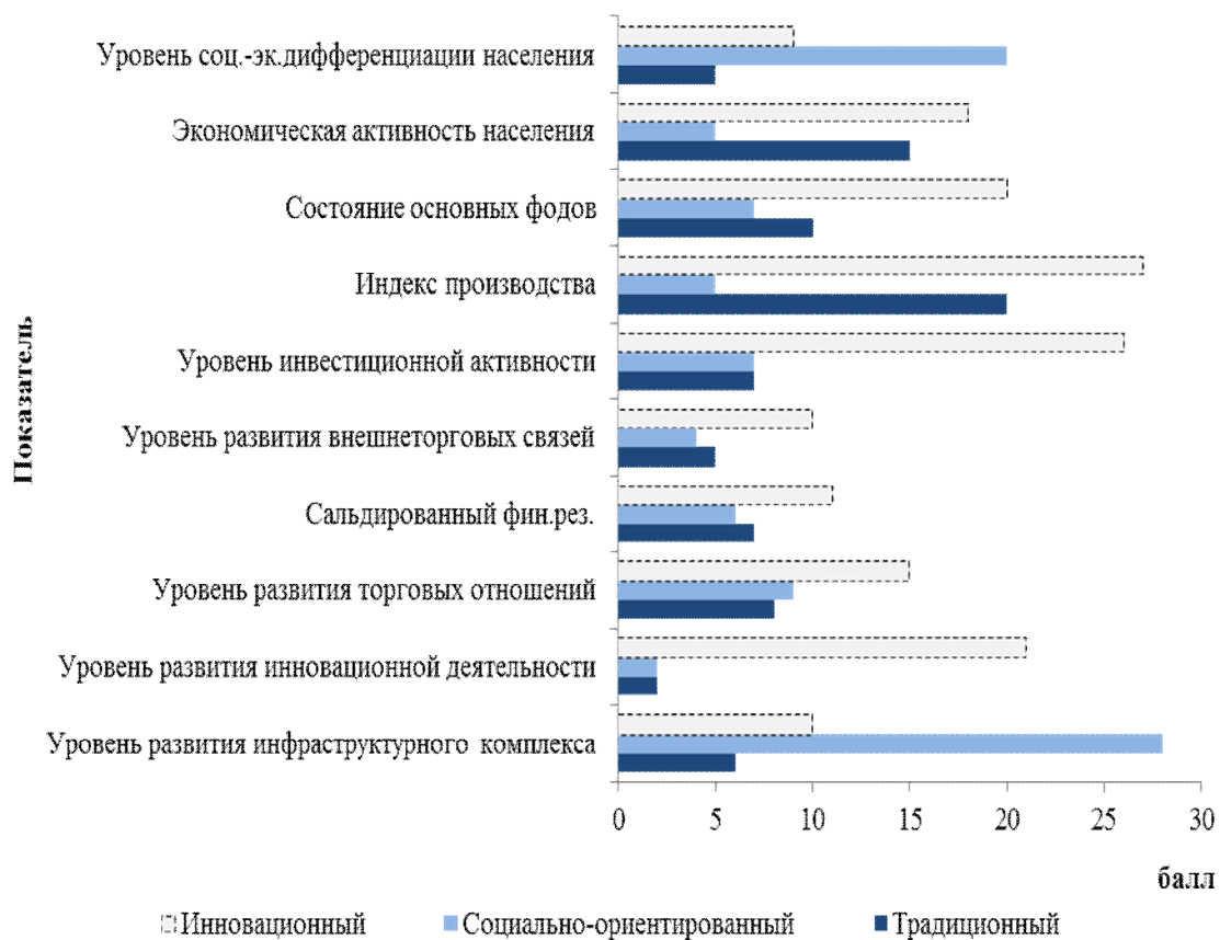
Рис.4. Целевые ориентиры «дорожных карт» в разрезе различных сценариев социально-экономического развития Белгородской области

Разработка мероприятий по достижению ключевых стратегических целей позволила автору сформировать целевые ориентиры «дорожных карт» (road map) с учетом долгосрочных приоритетов социально-экономического развития регионов на примере Белгородской области (рис.4).