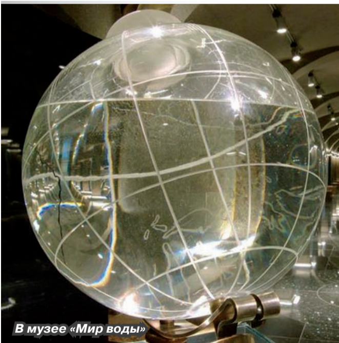
В музее «Мир воды»

Петербург открыл будущим географам свои тайны