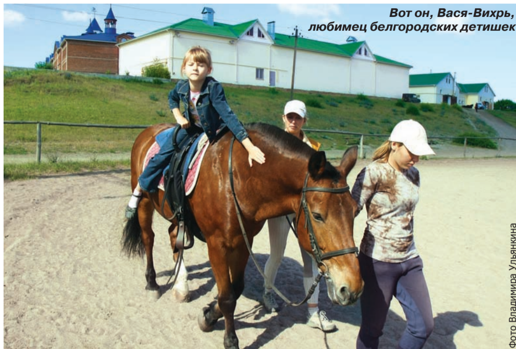
Вот он, Вася-Вихрь, любимец белгородских детишек

«Рост – от 145 до 155 сантиметров в холке; комплекция – «сбитая»; характер – спокойный и терпеливый; лошадь не должна иметь вредных привычек – не кусаться, не лягаться...» – перечисляя качества, обязательные для лошади-иппотерапевта, инструктор Настя как будто составляет словесный портрет Вихря. Он единственный из сорока скаунов, имеющих право в конноспортивной школе, подошёл три года назад для