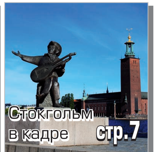
Стокгольм в кадре стр.7