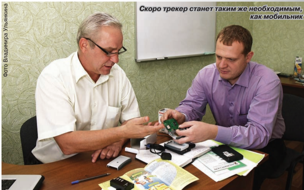
Скоро трекер станет таким же необходимым, как мобильник

Сотрудники предприятия и студенты кафедры природопользования и земельного кадастра ГГФ создают единую картографическую систе-