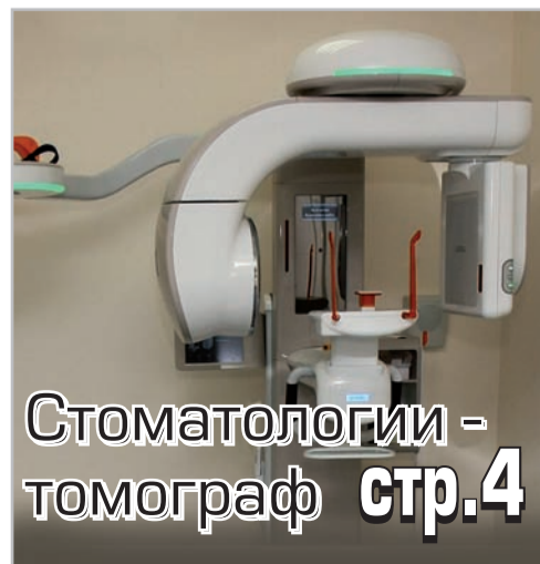
Стоматологии - томограф стр.4