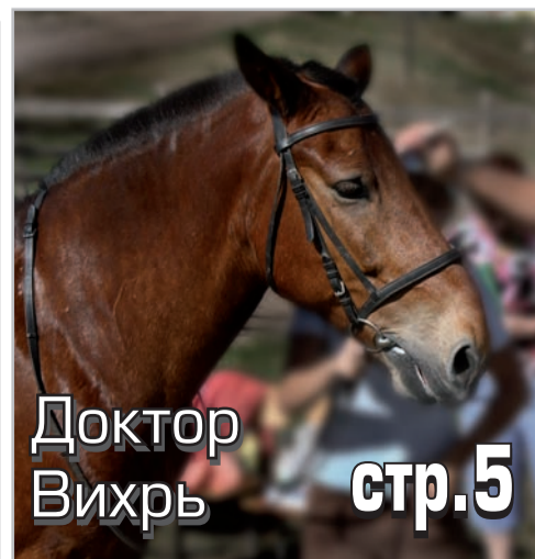
Доктор Вихрь стр.5