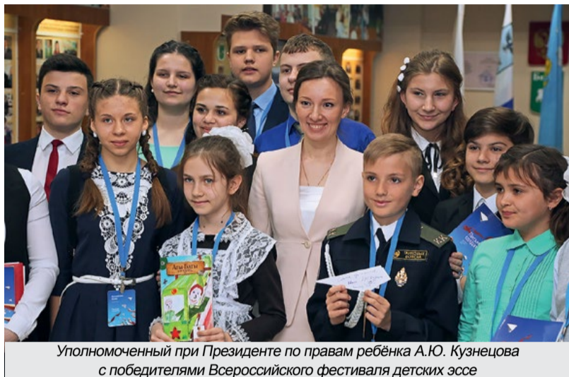
Уполномоченный при Президенте по правам ребёнка А.Ю. Кузнецова с победителями Всероссийского фестиваля детских эссе