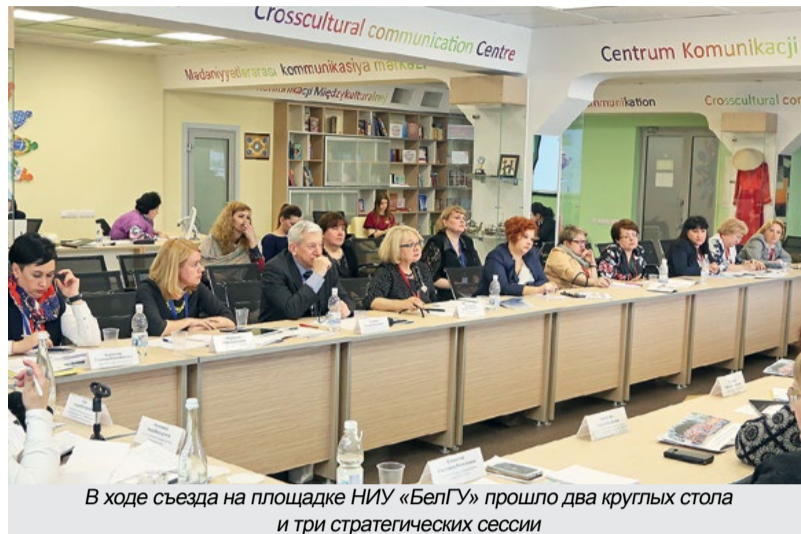
В ходе съезда на площадке НИУ «БелГУ» прошло два круглых стола и три стратегических сессии

На пленарной части форума выступили представители министерства образования и науки РФ, Совета Федерации, Следственного комитета РФ, общественных организаций. Выступавшие отмечали как положительный опыт в реализации государственной семейной политики, так и сложности в преодолении бюрократических барьеров, недоработки в законодательстве.