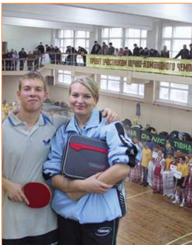
Участники чемпионата России по настольному теннису - в спортивном зале БелГУ