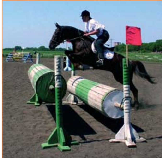
В конно-спортивной школе БелГУ. Наши спортсмены-конники - участники многих соревнований