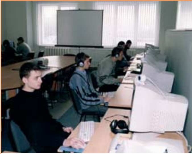
Студенты КНУИТ с компьютером на "ты"