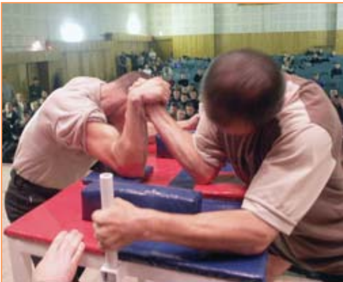
БелГУ, областной чемпионат по армрестлингу. Победа традиционно - за нами