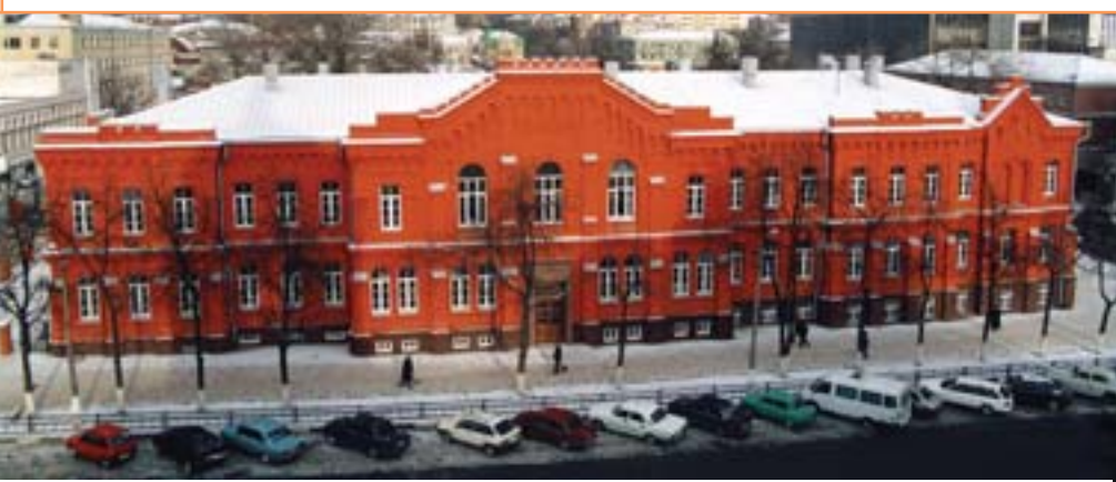
В этом здании, памятнике архитектуры XIX века, приятно учиться и отдыхать

Студенты факультета занимают призовые места в университетском и городском конкурсах художественной самодельности. Есть и собственная команда КВН: дружная, творческая, веселая. Студенты являются организаторами своего досуга: проводят вечера отдыха, организуют встречи с интересными людьми, весенние и осенние туристические походы, занимаются в спортивных секциях.