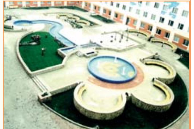
Внутренний дворик БелГУ. Здесь так хорошо посидеть, помечтать, отдохнуть после лекций