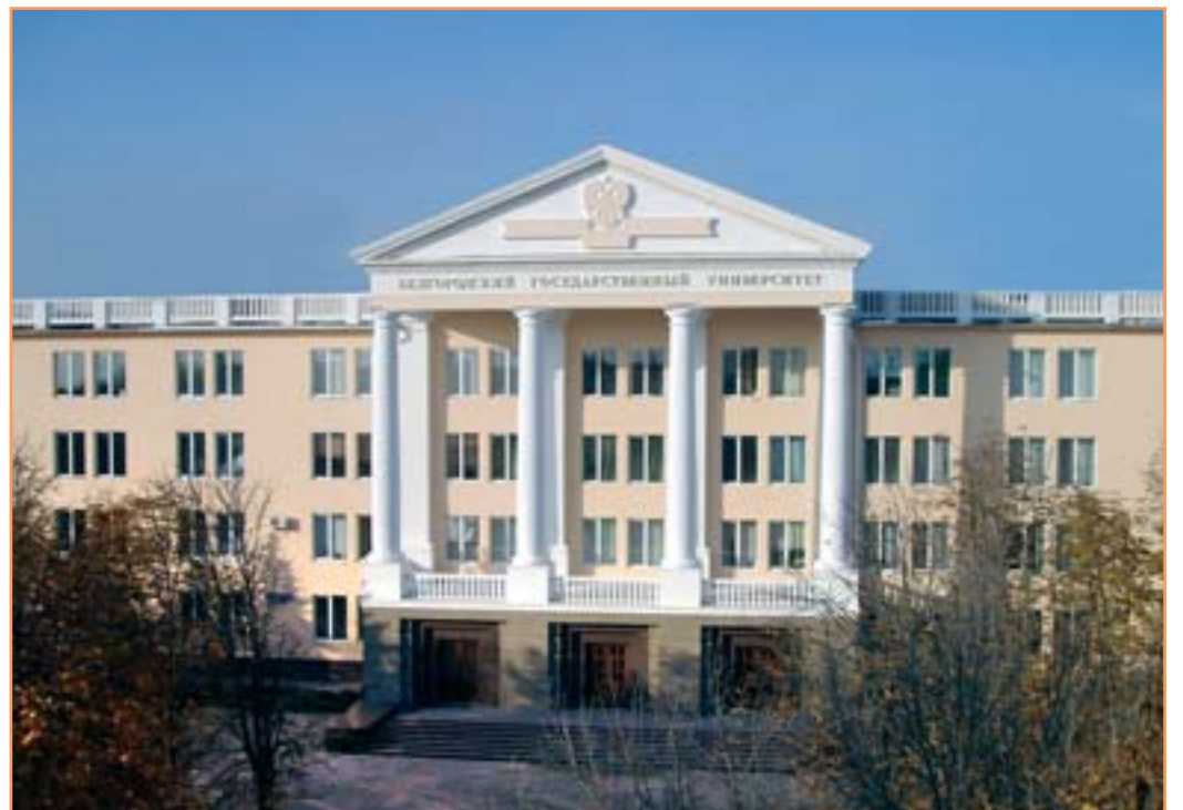
Реконструированное здание корпуса № 1 по ул. Студенческой