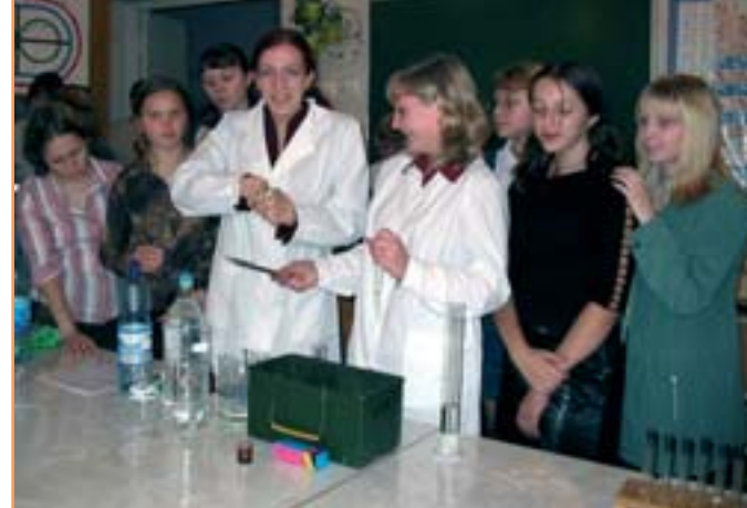
Химический десант. Студенты биолого-химического факультета - в гостях у шебекинских школьников

Лучшие студенты факультета являются неизменными участниками Международной студенческой конференции, которая проходит в Финансовой Академии при Правительстве РФ. На Всероссийской олимпиаде по экономическим, финансовым дисциплинам работы наших студентов занимают призовые места. Ежегодно студенты принимают участие в Международном Форуме "Образование, занятость, карьера".