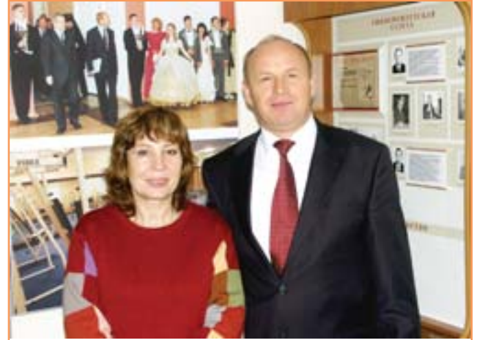
Народная артистка РФ Елена Камбурова - в числе знаменитых гостей БелГУ

За время учебы в университете студенты географы, геологи и природопользователи проходят различные полевые практики с выездом в разные районы Белгородской области и за ее пределы. Большой популярностью пользуется зональная практика в Архангельской области, где студенты знакомятся с суровой природой севера и посещают интересные природно-исторические места на Соловецких островах.