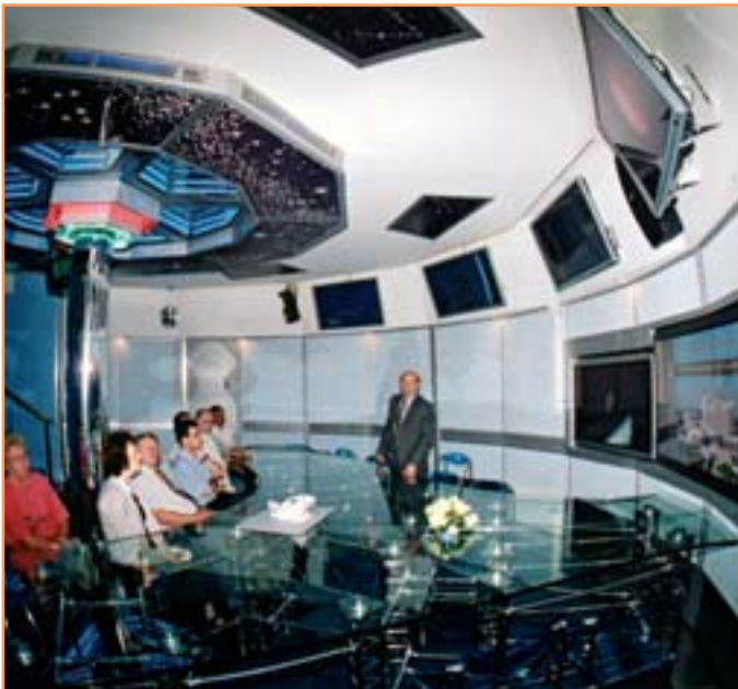
Центр аэрокосмического и наземного мониторинга природных ресурсов