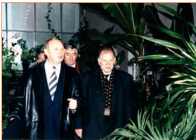
Нобелевский лауреат Жорес Иванович Алферов (справа) - на экскурсии в зимнем саду БелГУ