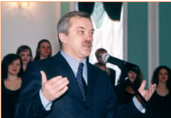
Е.С. Савченко, губернатор Белгородской области, доктор экономических наук, Почетный профессор БелГУ, председатель Попечительского совета университета