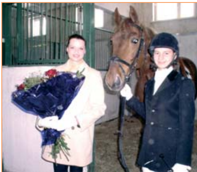
В гостях у спортсменов-конников университета - двукратная олимпийская чемпионка Светлана Хоркина, наша выпускница. Ее имя будет носить строящийся спорткомплекс БелГУ