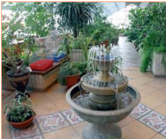
Зимний сад - излюбленное место отдыха студентов и преподавателей БелГУ. В нем цветут экзотические растения, живут игуаны и попугаи. Здесь всегда лето...