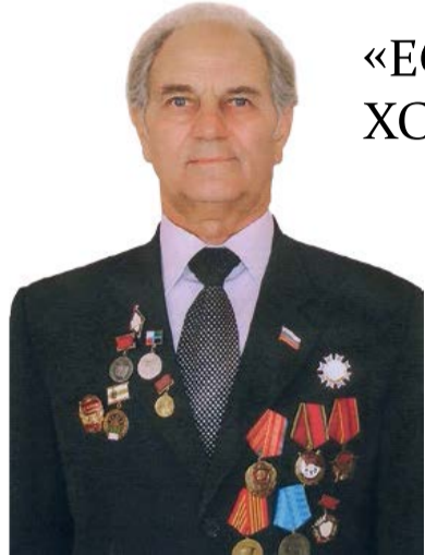
Василий ПОДЕРЯГИН, народный учитель СССР

Сегодня наши эксперты говорят о едином учебнике истории. Дискуссии на эту тему ведутся ещё с 2013 года.