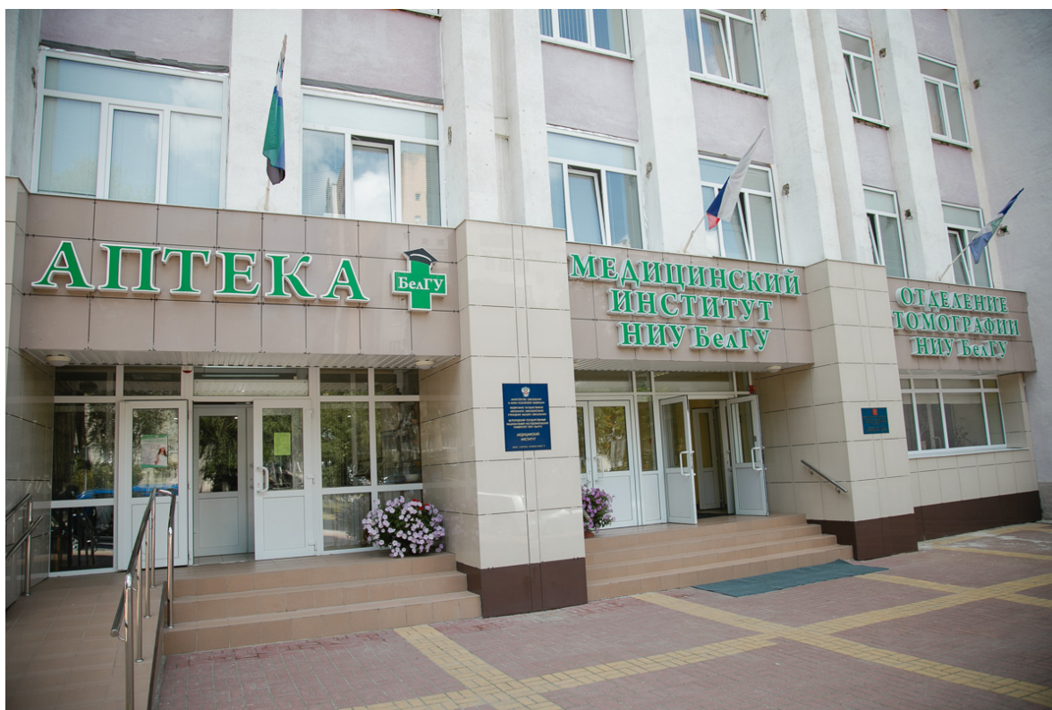
г. Белгород, Народный бульвар, 21, Медицинский институт НИУ «БелГУ»

Место проведения: г. Белгород, Народный бульвар 21, Медицинский институт НИУ «БелГУ», 19 корпус