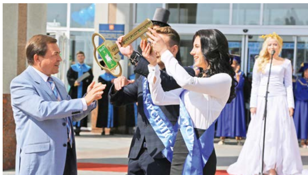
Вручение символического ключа знаний 1 сентября