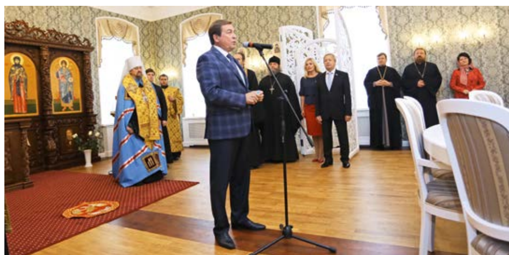
Открытие часовни святой преподобномученицы Евгении Римской на социально-теологическом факультете НИУ «БелГУ», 2016 год