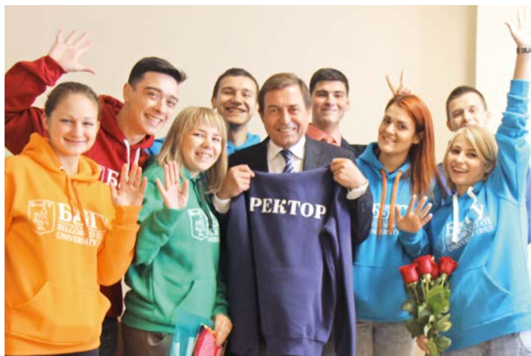
Ректор НИУ «БелГУ» со студенческим активом