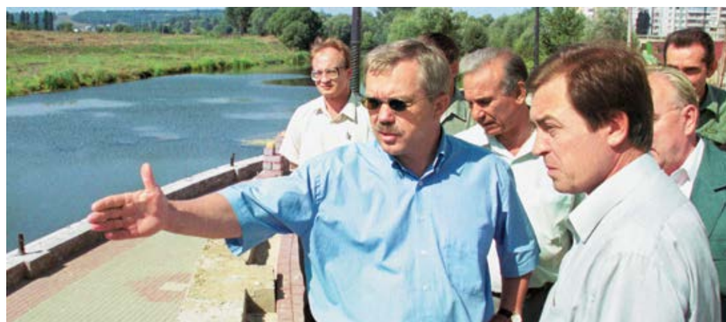
Е.С. Савченко, Глава администрации Белгородской области, Председатель правления Фонда содействия развитию БГУ и О.Н. Полухин, заместитель Главы администрации области, исполнительный директор Фонда содействия развитию БГУ на строительстве нового кампуса БГУ, 1999 г.