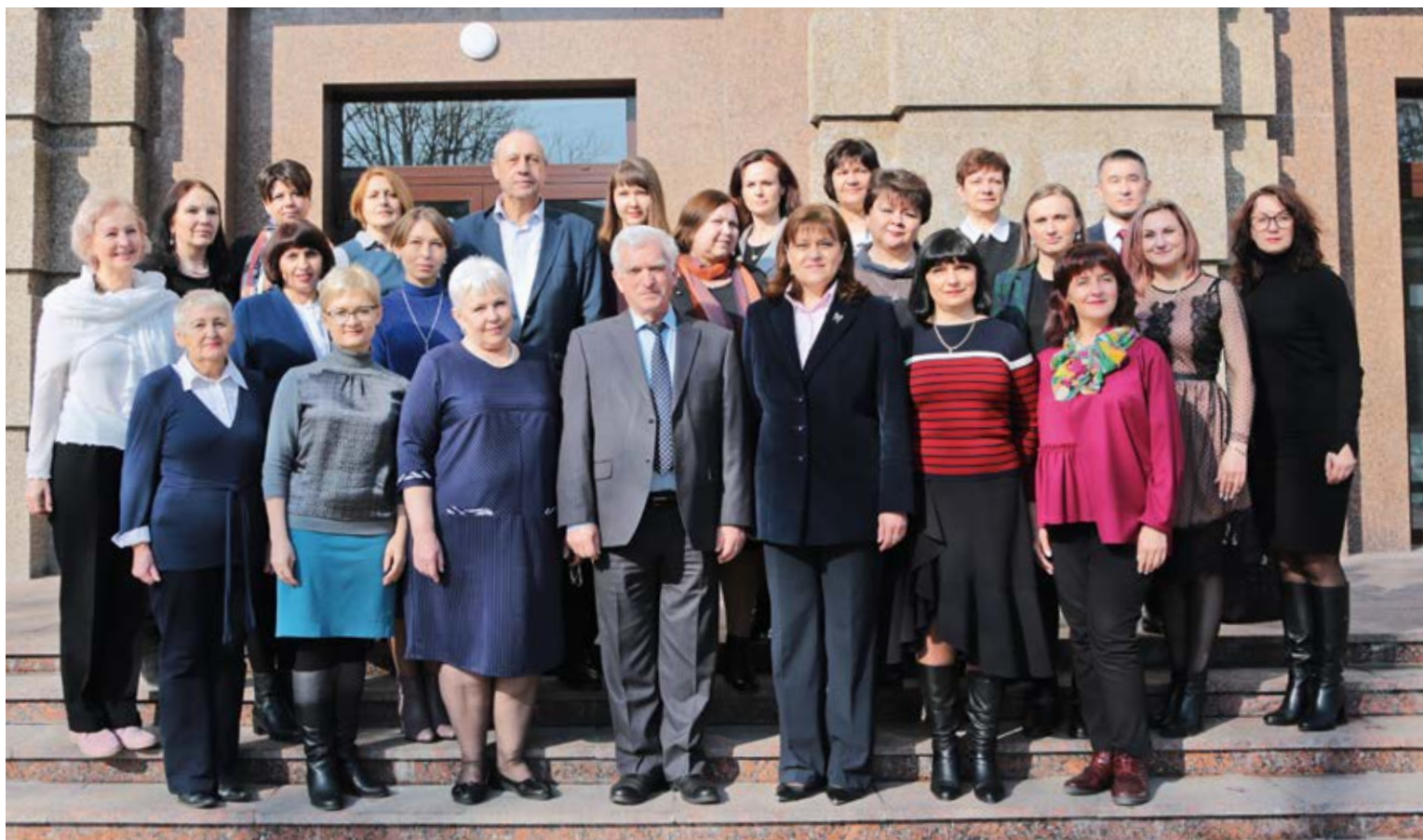
Коллектив кафедры педагогики с выпускниками-аспирантами