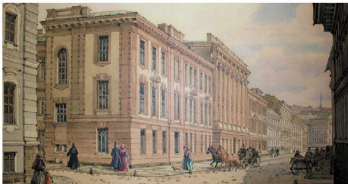
Вторая Санкт-Петербургская гимназия им. императора Александра I

Осенью 1844 года Страхов был вызван дядей в Петербург и с января 1845 года зачислен вольнослушателем по камеральному (соответствовал теперешнему юридическому) факультету, а в августе того же года поступил студентом на математическое отделение.