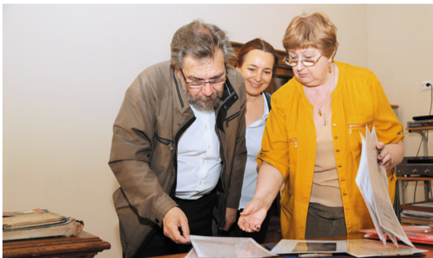
Учёные НИУ «БелГУ» во Второй Санкт-Петербургской гимназии им. императора Александра I, где преподавал Н.Н. Страхов