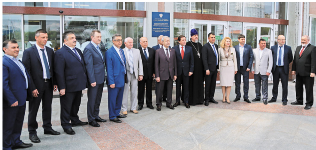
Участники юбилейных торжеств – руководители региональных и федеральных органов власти и правоохранительных структур