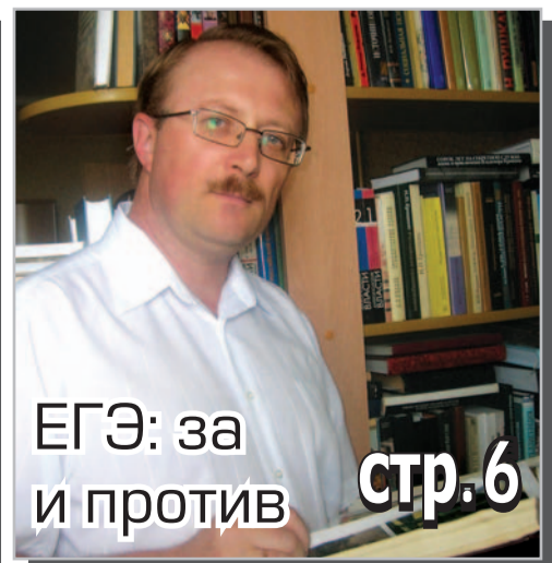
ЕГЭ: за и против стр. 6