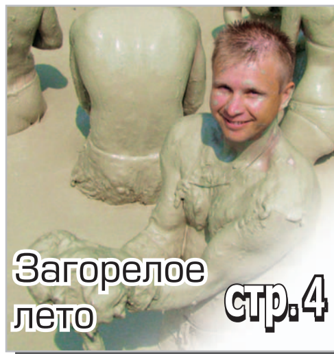
Загорелое лето стр. 4