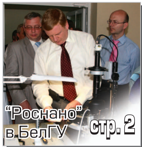
“Роснано” в БелГУ стр. 2