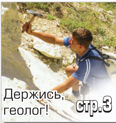
Держись, геолог! стр. 3