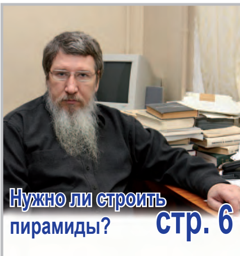
Нужно ли строить пирамиды?