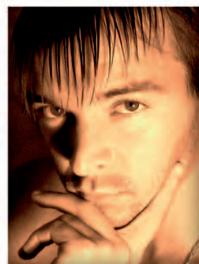
➤ Представляем автора