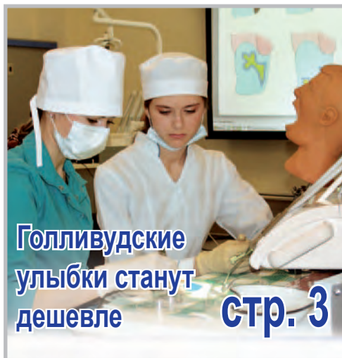
Голливудские улыбки станут дешевле