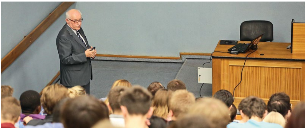
Член-корреспондент РАН Юрий Попков читает лекцию студентам НИУ «БелГУ», сентябрь 2015 г.

Инновационный путь развития, системная модернизация Белгородского государственного национального исследовательского университета, формирование на базе НИУ «БелГУ» предпринимательской экосистемы превратили университет в подлинный центр коммуникации бизнеса, общества и государства по вопросам научно-технологического прогресса.