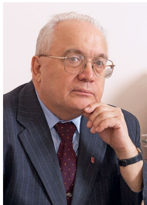
САДОВНИЧИЙ Виктор Антонович,

Пусть в большой вузовской семье всегда царят гармония и согласие! От души желаю всем преподавателям, сотрудникам и студентам Белгородского государственного университета доброго здоровья, благополучия, реализации всех намеченных планов и дальнейших успехов в многогранной деятельности на благо Белгородчины и России!