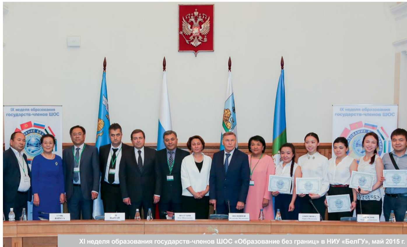
XI неделя образования государств-членов ШОС «Образование без границ» в НИУ «БелГУ», май 2015 г.

Международная деятельность в НИУ «БелГУ» ведётся с 1980 года, когда в Белгородском государственном педагогическом институте был открыт подготовительный факультет для иностранных граждан. Единственный на тот момент вуз в России, готовивший иностранцев для дальнейшей учёбы в педагогических вузах, он стал центром получения базового образования для более четырёх тысяч студентов из Европы, Азии, Африки и Латинской Америки.