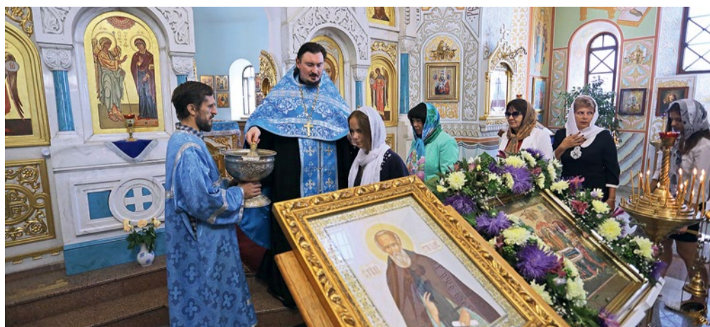
Служба в домовом храме Архангела Гавриила НИУ «БелГУ», сентябрь 2016 г.