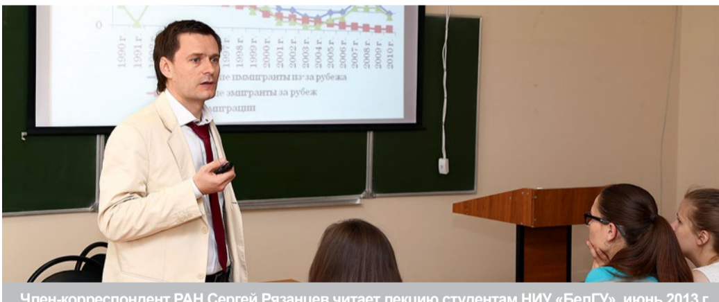
Член-корреспондент РАН Сергей Рязанцев читает лекцию студентам НИУ «БелГУ», июнь 2013 г.