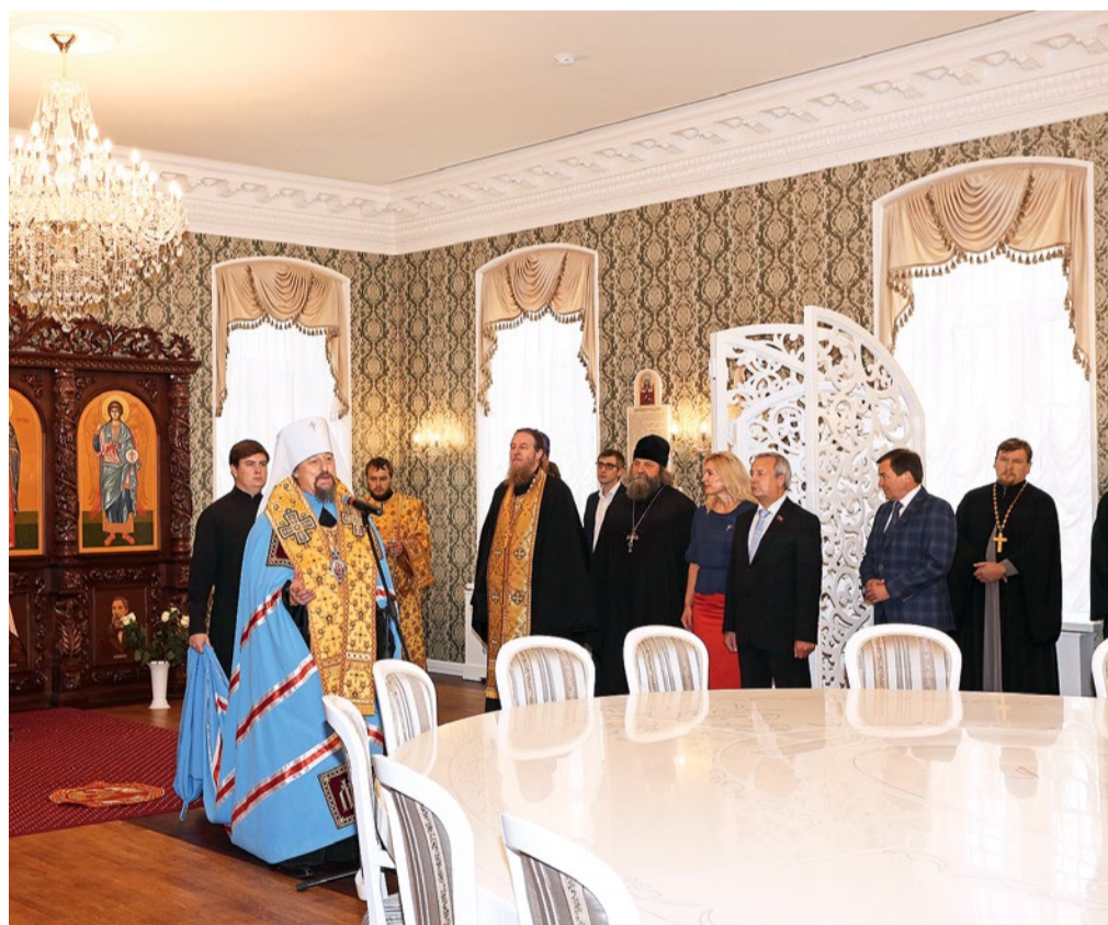
Торжественная церемония открытия храма-часовни во имя святой преподобномученицы Евгении Римской, сентябрь 2016 г.

Сотрудничество с митрополией с каждым годом расширяется, появляются новые совместные проекты. В сентябре, в честь 140-летия университета, на базе социально-теологического факультета НИУ «БелГУ» открыты Духовно-просветительский центр имени митрополита Макария (Булгакова), и воссозданный храм-часовня во имя святой преподобномученицы Евгении Римской. Накануне юбилейных торжеств завершилась роспись домового храма университета, построенного и освящённого в честь Архангела Гавриила 15 лет назад.