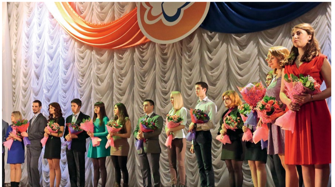
Торжественная церемония вручения студентам стипендий фонда «Поколение», март 2015 г.

Ректор выразил благодарность всем попечителям и благотворителям, которые внесли свой вклад в возрождение и создание многих социально-культурных, просветительских объектов, которые откроются накануне юбилея университета. В юбилейные дни в главном корпусе университета будет открыта галерея попечителей и благотворителей НИУ «БелГУ».