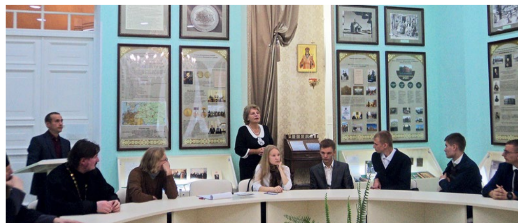
Торжественная церемония открытия Духовно-просветительского центра имени митрополита Московского и Коломенского Макария (Булгакова), сентябрь 2016 г.