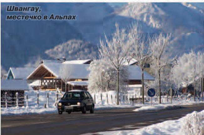
Швангау, местечко в Альпах