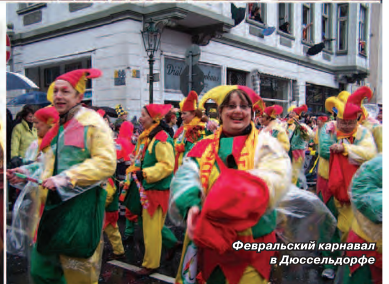
Февральский карнавал в Дюссельдорфе