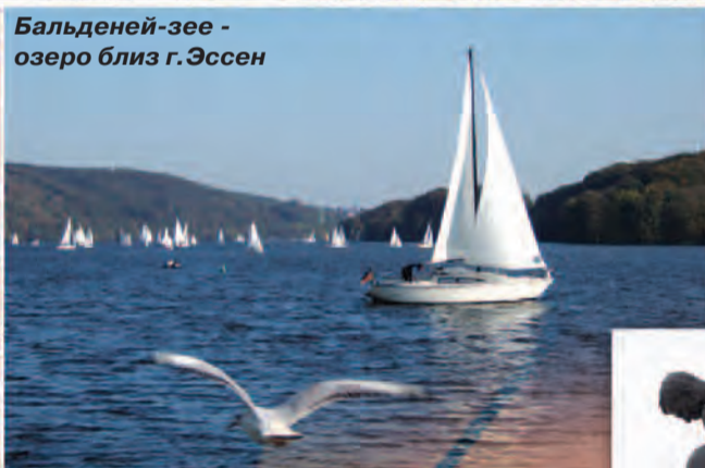
Бальденей-зее - озеро близ г.Эссен