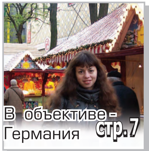
В объективе Германия стр. 7