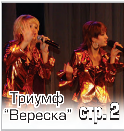
Триумф «Вереска» стр. 2