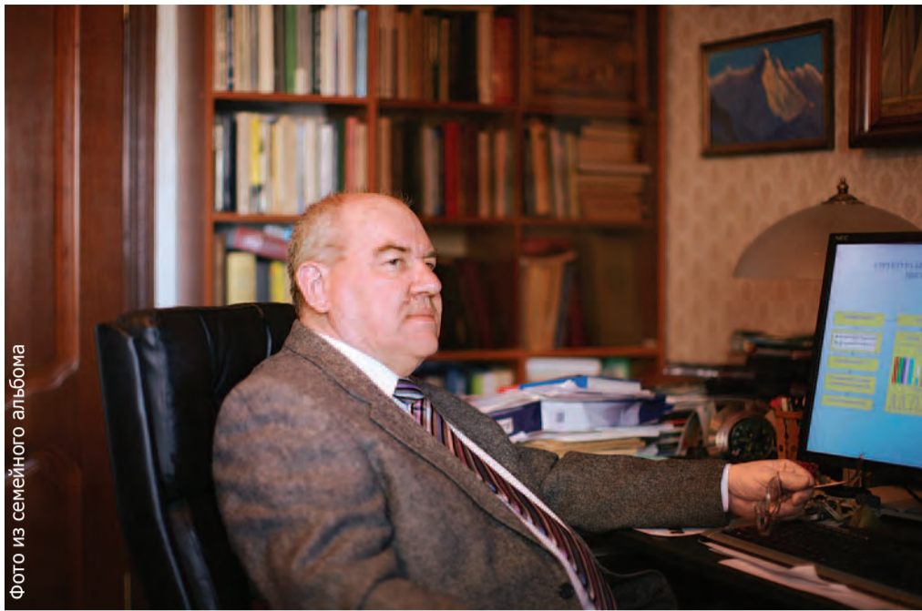
Фото из семейного альбома