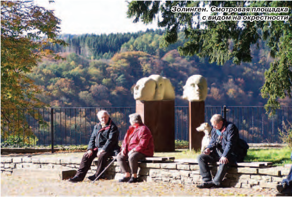
Золинген. Смотровая площадка с видом на окрестности