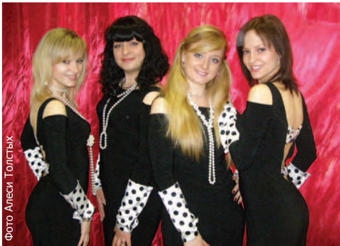
Фото Алеси Толстых

Солисты арт-студии «Вереск» вернулись из Москвы победителями. На этот раз вокальный коллектив представлял БелГУ на XVI Московском фестивале студенческого творчества «ФЕСТОС-2009». Солисты «Вереска» стали лауреатами в номинации «Студенческий марафон эстрадной песни». Отличные голоса, высокий уровень подготовки и яркие костюмы впечатлили москвичей, а вокальные композиции в исполнении солисток вызвали восторженное «Браво!» даже у членов жюри.