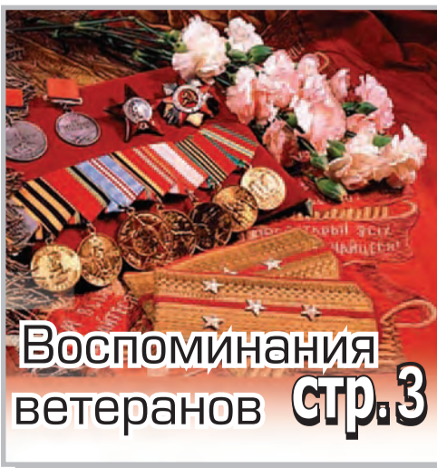
Воспоминания ветеранов стр. 3