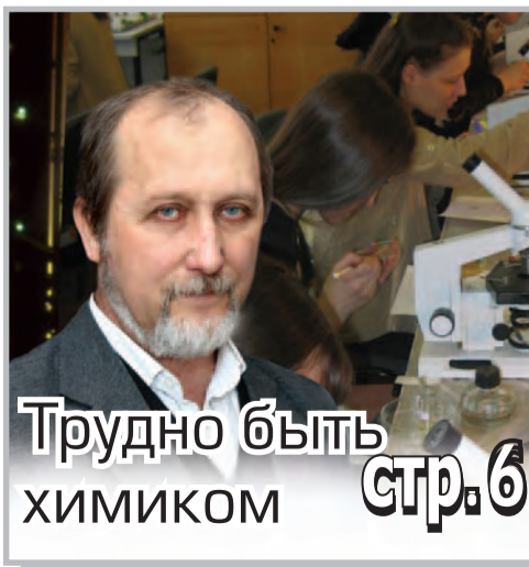
Трудно быть химиком стр. 6