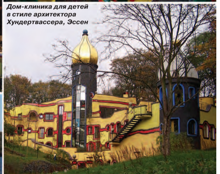
Дом-клиника для детей в стиле архитектора Хундертвассера, Эссен