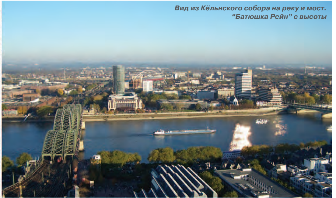
Вид из Кёльского собора на реку и мост. "Батюшка Рейн" с высоты

Фотография еще в годы студенчества стала для меня одним из любимых увлечений, а учеба в университете и иностранные языки помогли расширить границы моего творчества. Благодаря академическим обменам я неоднократно имела возможность учиться в вузах Германии и путешествовать по Европе.