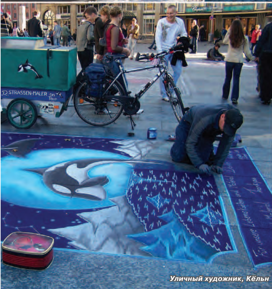
Уличный художник, Кёльн