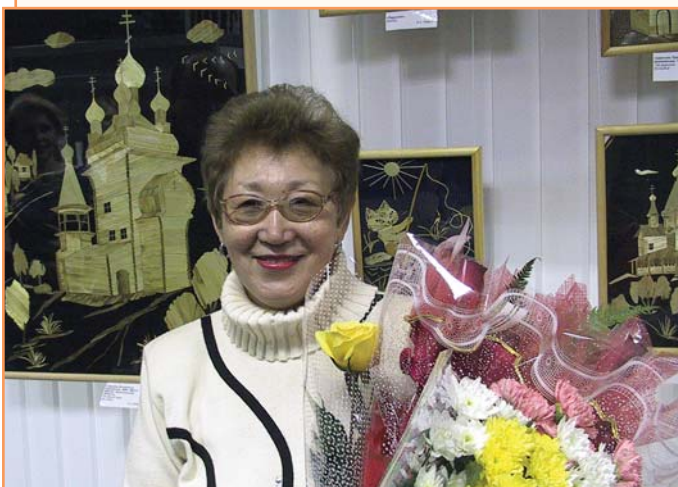
Более 30 работ К. Умаровой выставлены в нашем музее.