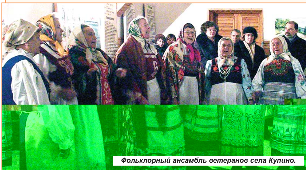
Фольклорный ансамбль ветеранов села Купино.