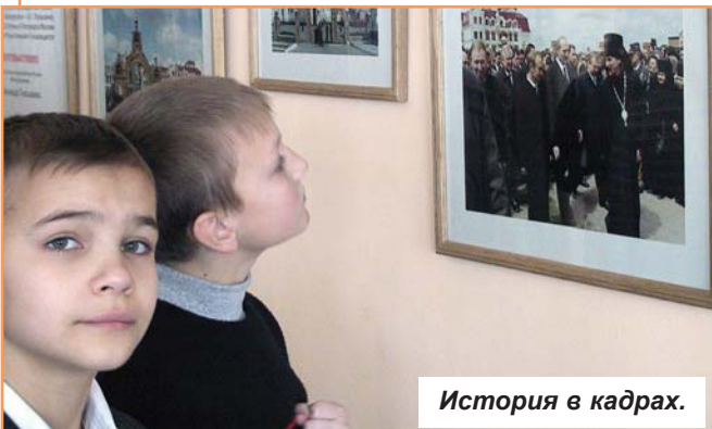
История в кадрах.