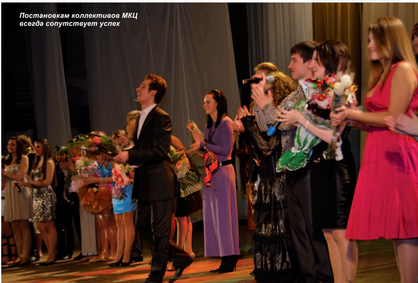
Постановкам коллективов МКЦ всегда сопутствует успех