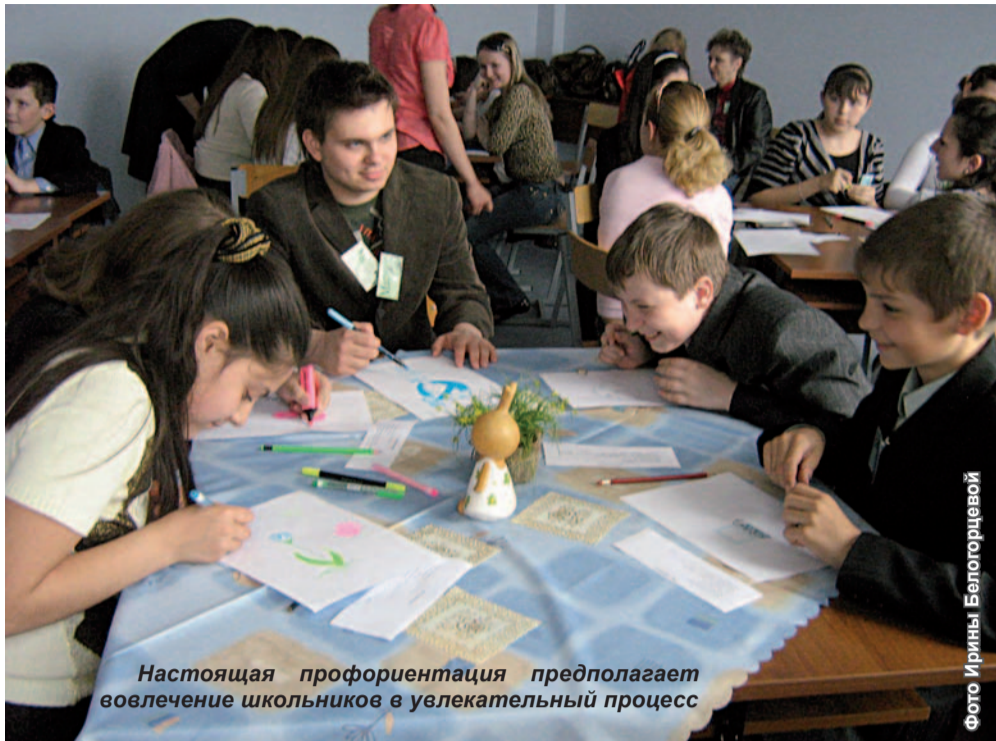
Настоящая профориентация предполагает вовлечение школьников в увлекательный процесс