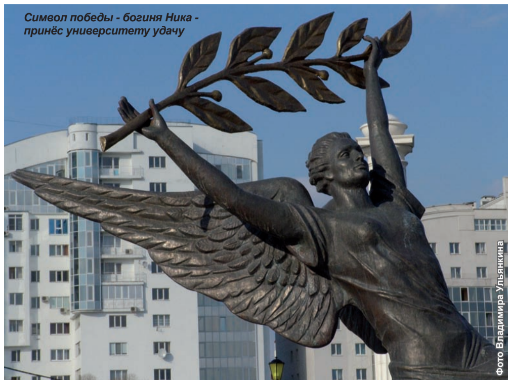
Символ победы - богиня Ника - принёс университету удачу

XXI век — век университетов, век экономики знаний, век инноваций. В силу того, что вуз — динамичная структура, реаги-