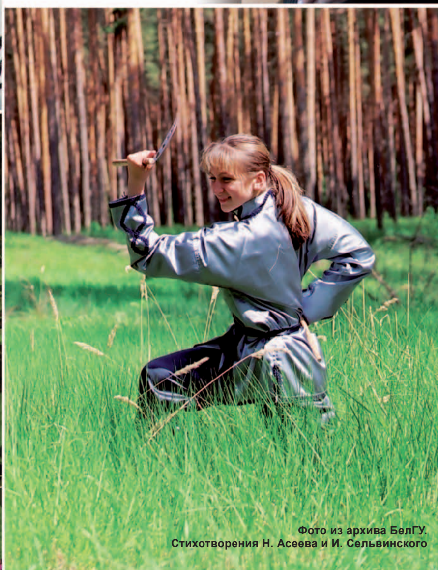
Стихотворения Н. Асеева и И. Сельвинского