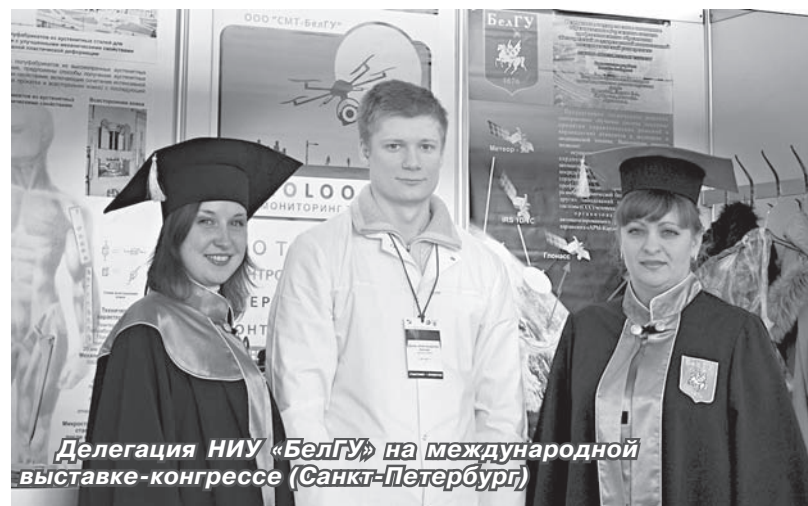
Делегация НИУ «БелГУ» на международной выставке-конгрессе (Санкт-Петербург)

Кроме проектов-победителей, на экспозиции НИУ «БелГУ» была представлена наукоёмкая продукция малых инновационных предприятий: ООО «СМТ-БелГУ», ООО «Наноапатит», ООО «Термоэнергия-БелГУ», ООО «Металл-деформ». Сотрудниками презентационно-выставочного