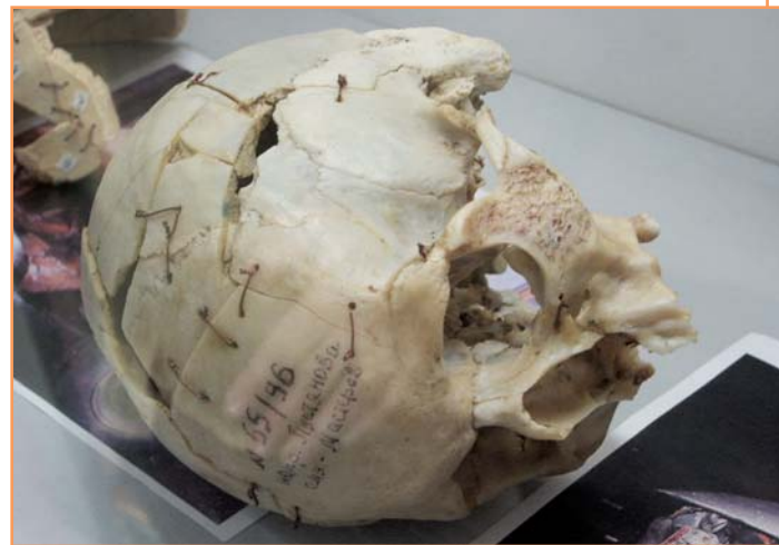
Один из многочисленных экспонатов Музея судебной медицины.