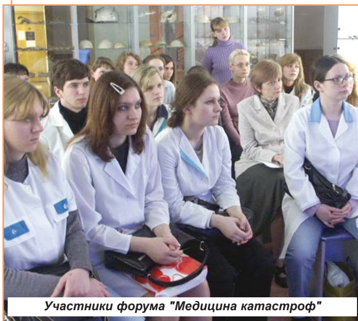
Участники форума "Медицина катастроф"