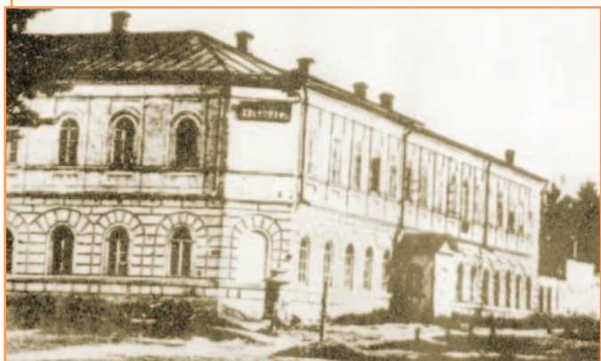
Здание, в котором с 1876 по 1919 гг. размещался Белгородский учительский институт

26 сентября 2004 года исполняется 128 лет со дня рождения Белгородского учительского института