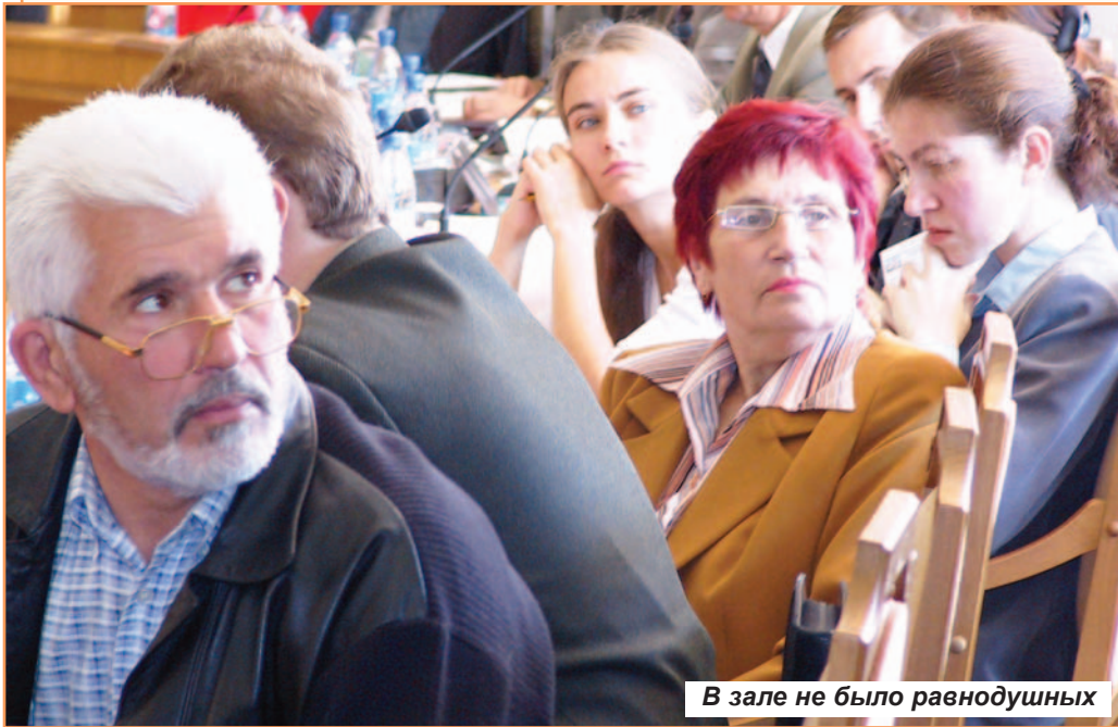
В зале не было равнодушных

кой науки и высших учебных заведений из 30 городов разных стран. Широко обсуждались актуальные направления геоэкологии. Большое количество докладов было представлено учеными БелГУ.