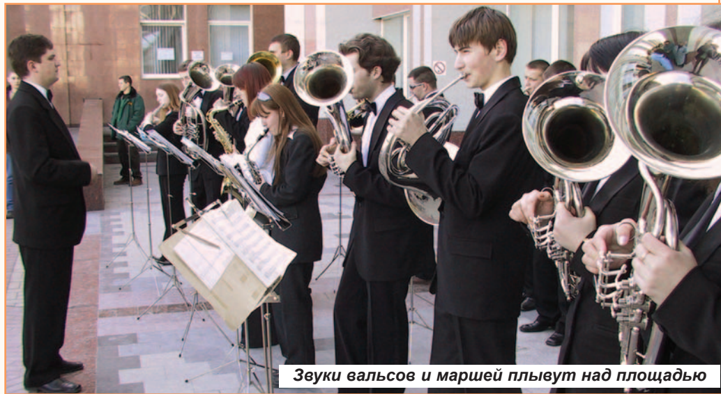
Звуки вальсов и маршей плывут над площадью

Кроме совместных репетиций, проводятся индивидуальные занятия.