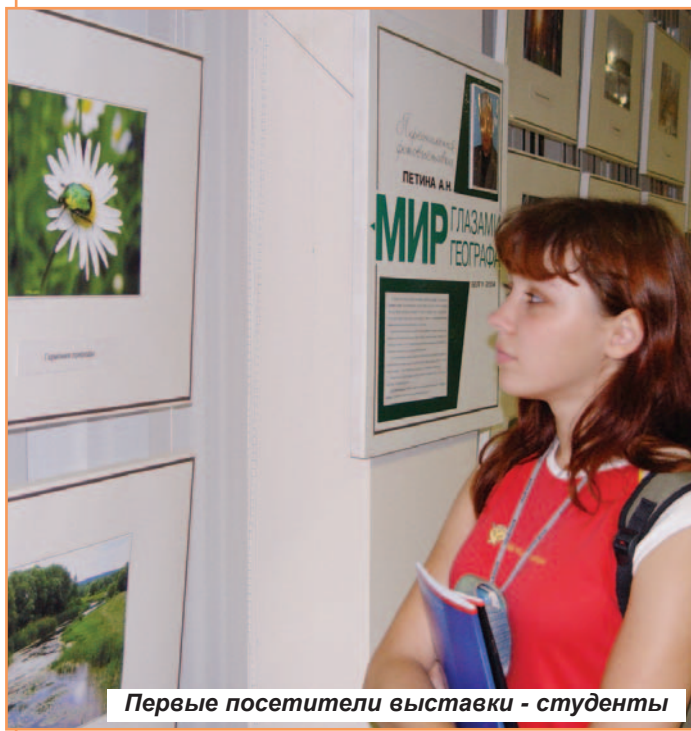
Первые посетители выставки - студенты

Ольга СКЛЯР, Ольга ПЕТРЕНКО (отделение журналистики).