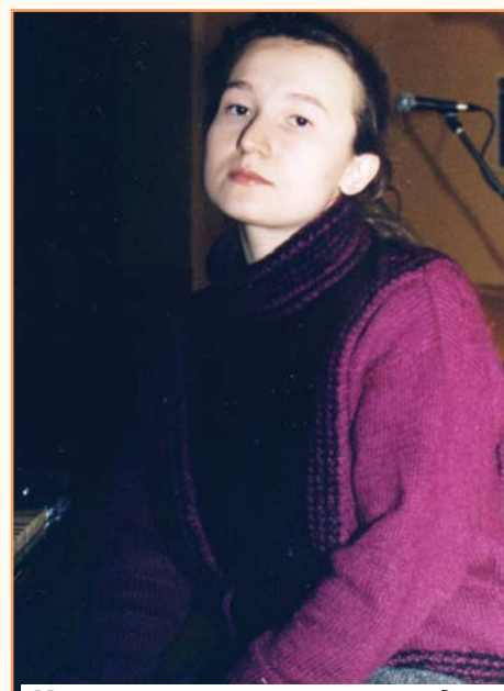
Музыка - ее жизнь, ее мечта, ее душа

- У меня есть цель. К тому же, я занималась индивидуально, а это дает большую эффективность. Через год я уже прилично владела немецким и могла поступить в университет.