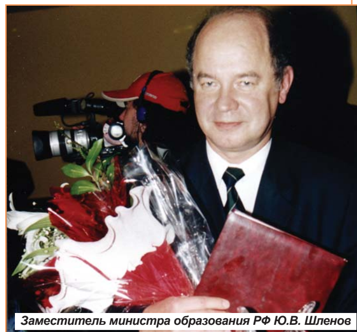
Заместитель министра образования РФ Ю.В. Шленов