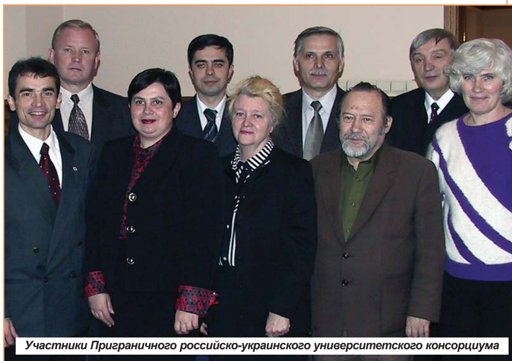
Участники Приграничного российско-украинского университетского консорциума