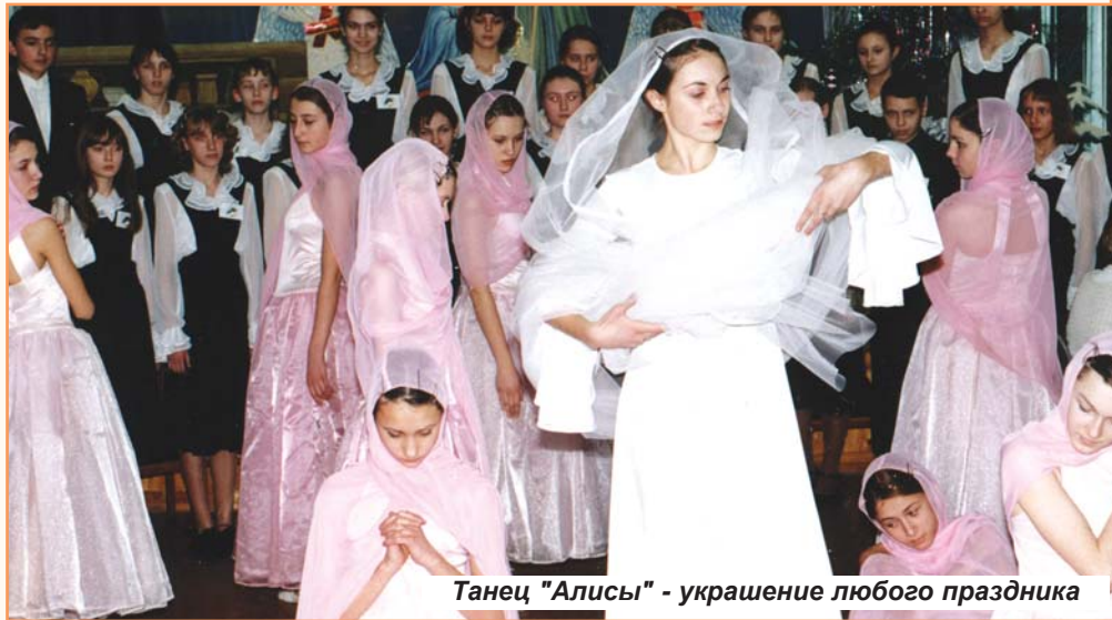
Танец "Алисы" - украшение любого праздника