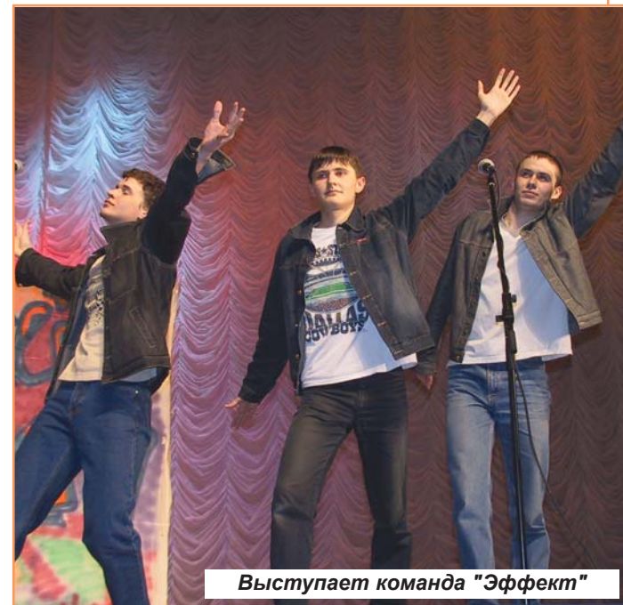
Выступает команда "Эффект"

Студенты - самый веселый и находчивый народ в мире. Для того, чтобы убедиться в справедливости этой фразы, достаточно хотя бы однажды сходить на КВН. 24 февраля в Молодежном культурном центре БелГУ состоялась встреча одной четвертой финала университетской лиги. Скрестить шпаги решились команды "Аномалия" (ГГФ) и "Побочный эффект" (СПФ). Заявленная ранее команда факультета КНИТ в этот вечер на сцене так и не появилась. Возможно, именно из-за ее отсутствия и недостаточно жесткой конкуренции игра протекала довольно вяло, на "четыре с минусом".