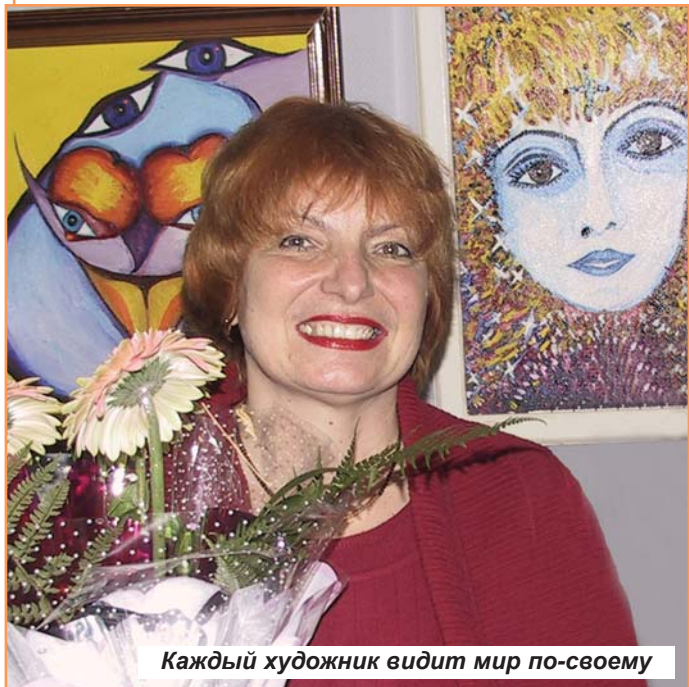
Каждый художник видит мир по-своему

Тематика ее произведений разнообразна, о чем свидетельствуют названия картин: "Любовь", "Орхидеи", "Пробивание спящего мозга", "Плод", "Чечня" и др. (их можно увидеть на сайте БелГУ). Однако все работы объединены общей идеей. По словам автора, эти картины о самом главном в жизни: о рождении, любви, смерти.